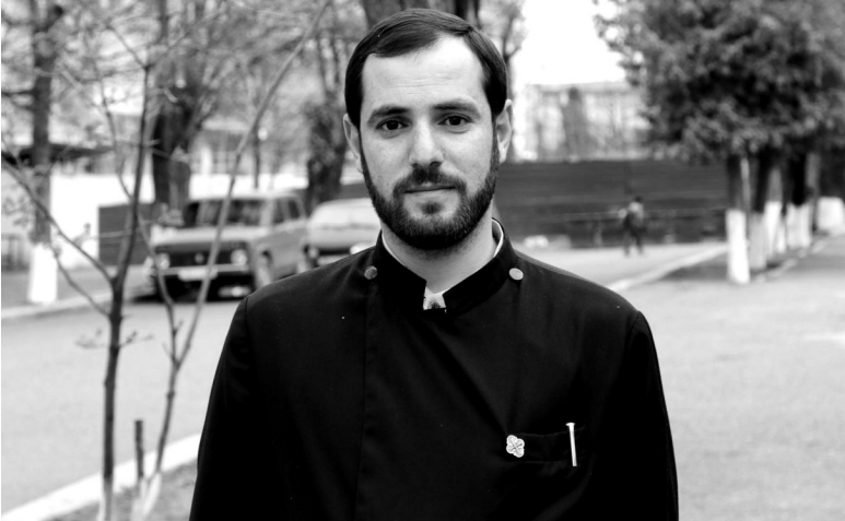
Պատերազմի թե՛ կետերում եղած գինծառայողներն ունեցել են որոշակի հոգեբանական խնդիրներ

մատուցել, առաջնաերթ պիտի լինի առաջնագծում կանգնած գինվորի հետ եւ կիսի նրա հոգսը, առօրյան: Եվ այս առումով՝ մեր հոգեւորականները գտնվում են իրենց գինվորների կողքին, առաջնագծում եւ մտահոգվում են նրանց հոգսերով, ուրախանում նրանց ուրախություններով, փորձում են հայրենիքի հանդեպ իրենց ծառայությունը մատուցել եւ օգնել, որպեսզի գինվորները լսեն Աստծո խոսքի մասին, մասնակցի լինեն հոգեւոր արարողություններին, դրանց միջոցով համախմբվեն, միասնականություն ձեռք բերեն, լինեն մեկ ընտանիք: Հոգեւորականը գործառնական քարոզում է, որ գործառնական բազմաթիվ անդամներից բաղկացած տուն է, ընտանիք, յուրաքանչյուր գինծառայող այդ ընտանիքի մի անդամ է, որտեղ պիտի տիրի սերը, համերաշխությունը, միասնականությունը, փոխհամաձայնությունը, փոխըմբռնվածությունը, որպեսզի կարողանան կատարել մեր հայրենիքի եւ մեր ազգի հանդեպ ծառայությունը: