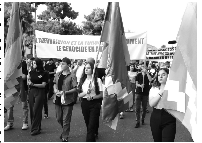
Եկեք բոլորս միասին աղոթք բարձրացնենք առ ամենակալն Աստված մեր ազգի պահպանության, հարատևության և բարոր կյանքի համար»:

Այս նվիրական օրը ձեզ ենք բերում նաեւ Մայր Աթոռ Սուրբ Էջմիածնի և Նրա գահակալի՝ Ամենայն Հայոց Գարեգին Բ Վեհափառ Հայրապետի ջերմագին օրհնություններն ու բարեմաղթանքները: