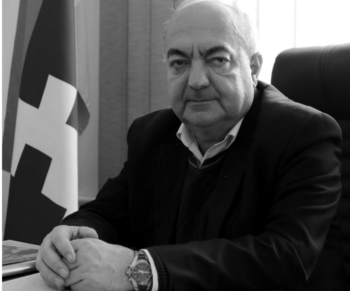
Արման Ավակյան, ԱՀ ԱԾ նախագահի տեղակալ:

- Մեծ տեղ են հատկացնում Արցախում ՀՀ կառույցների աշխատանքին մի շարք ուղղություններով: Նախ, ակախության տարիներին ՀՀ Դաշնակցությունը Արցախում կրթական, մշակույթի ասպարեզի զարգացման համար ֆինանսական եւ տեխնիկական առու-