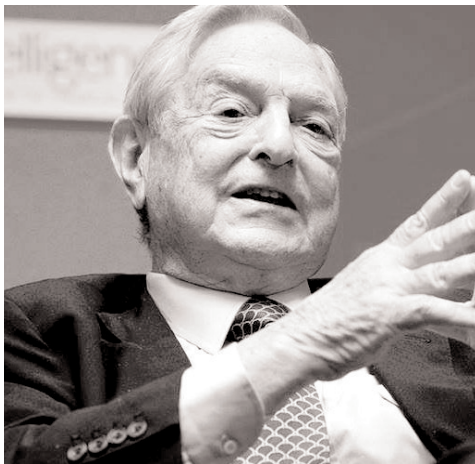
Կյանքը, ֆինանսական գործունեությունը

Ես երբեք չեմ խաղում մեկ կանոնի շրջանակներում, ես միշտ փորձում եմ փոխել խաղի կանոնները՝ դրանք հարմարեցնելով ինձ: