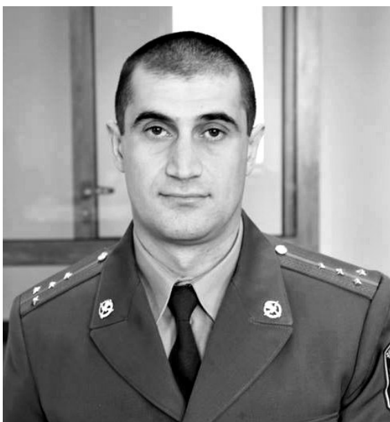
Ամեն մի բացվող առավոտ նվեր է տրված մահկանացուներին, բայց միայն նա, ով զգացել է մահվան շունչը, գիտի կյանքի ամեն մի օրվա արժեքը...

Ստեփանյանների ընտանիքում հայրենասիրությունը ժառանգաբար փոխանցված գիծ է: Ընտանիքի հայրը՝ Վանիկը, Արցախյան գոյապայքարի մասնակիցն է: Ծառայել է «Սասունցի Դավիթ» ջոկատում, եւ իր մարտական ընկերոջ՝ Արկարի Տեր-Թադևոսյանի հետ երկար մարտական ուղի