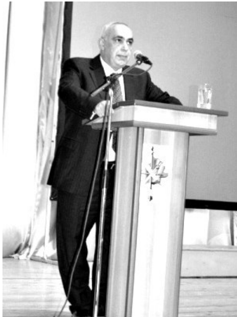
ԼՂՀ փոխվարչապետ, ՀՀ Արցախի ԿԿ անդամ Արթուր Աղաբեկյանի ելույթը Ստեփանակերտում կայացած ՀՀ 124-ամյակի տոնակատարության ժամանակ,

Մեծարգո պարոն նախագահ, Գերաշնորհ Սրբազան հայր, հարգելի հյուրեր, սիրելի ընկերներ,