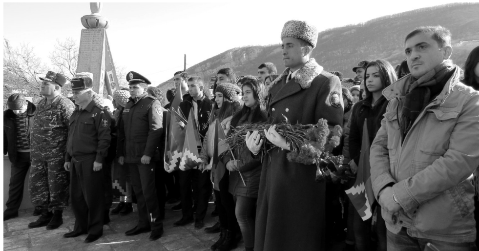
Շուշիի Ղազակեցոց եկեղեցում գոհված ազատամարտիկների հիշատակին կազմակերպված մոմավառությանը մասնակցելուց հետո՝ շրջաններից եւ մայրա-

տասարդության հարցերի նախարարությունը նախաձեռնել էր «Ննջեցեք խաղաղությամբ, ձեր գործը շարունակում ենք» խորագիրը կրող միջոցառում: