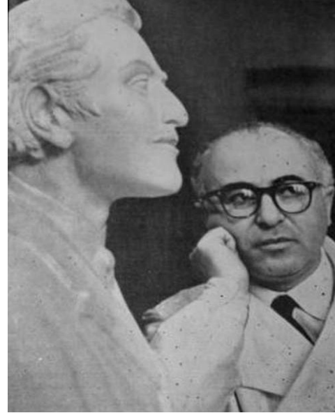
դարձնում գիտնականի կենսագրական էջը:

Վերջերս այցելելով թանգարան՝ գիտնականի որդի, քանդակագործ Վլադիմիր ճաղարյանը հոր մասին պատմող ցուցանմուշներով համարել է թանգարանի էջը, այդ թվում՝ նրա վիրաբուժական գործիքները, Մարտիրոս Սարյանի նկարած գիտնականի դիմանկարը, տարբեր երկրներից բերված նվիրատվություններ, մասնավորապես՝ արաբական սուլթաններից մեկի նվիրած ձեռնափայտ ու գլխաշորը, որոնք ավելի ամբողջական են