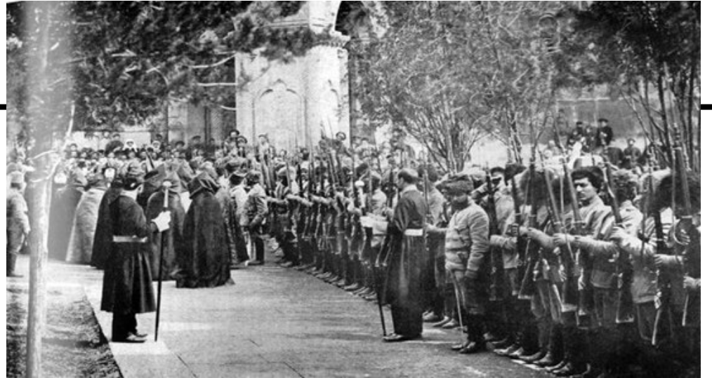
Կաթողիկոս Գեորգ Ե օրհնում է կամավորականներին