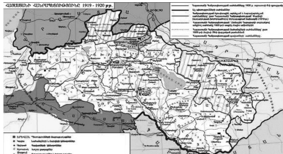
Հայաստանի Առաջին Հանրապետության տարածքը 1920 թվականին