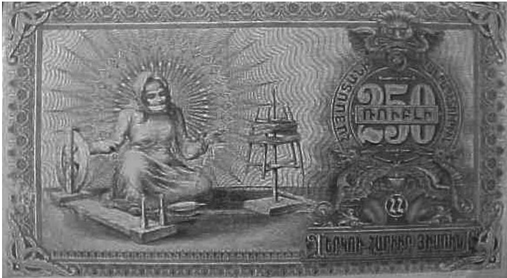
Հայաստանի Առաջին Հանրապետության ազգային դրամը