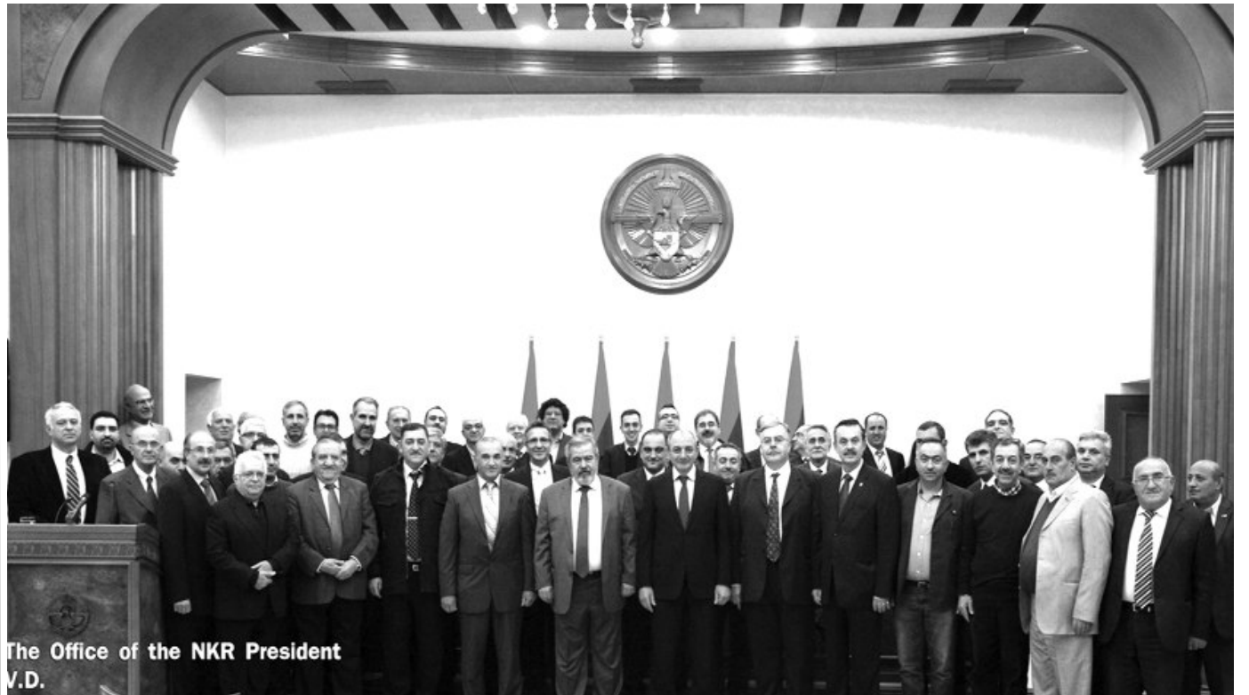
The Office of the NKR President V.D.

Եվ այստեղ է, որ միջազգային հանրությունը պարտավոր է շտկել եւ կարգի հրավիրել ամբողջ մարդկության զարգացման համար խնդիրներ ստեղծող Թուրքիային եւ Ադրբեջանին: