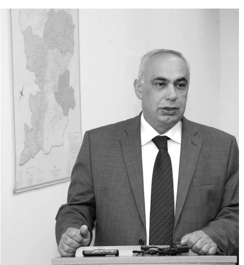
Մեկ տարի առաջ ԼՂՀ Կառավարությունը եւ Հայ օգնության միությունը ծրագրել են Ստեփանակերտի «Սոսե» մանկապարտեզի նորակառույց շենքի շինարարությունը: Այդ ծրագրի շրջանակներում ԼՂՀ փոխվարչապետ Արթուր Աղաբեկյանը, գտնվելով ԱՄՆ-ում, մասնակցել է այնտեղ կազմակերպված մի շարք դրամահավաք միջոցառումների:

հետ գրույցում ասել է Արթուր Աղաբեկյանը. «Ստեփանակերտի «Սոսե» մանկապարտեզի շենքն իր տեսակով բացառիկ է լինելու ԼՂՀ տարածքում, գո՛րցե նաեւ՝ ՀՀ տարածքում, եւ այդ ծրագիրը մոտ 1 միլիոն դոլարից ավելի ծրագիր է, որը պետք է կյանքի կոչվի 2016 թ. եւ 2017 թ. առաջին կիսամյակի ընթացքում»: