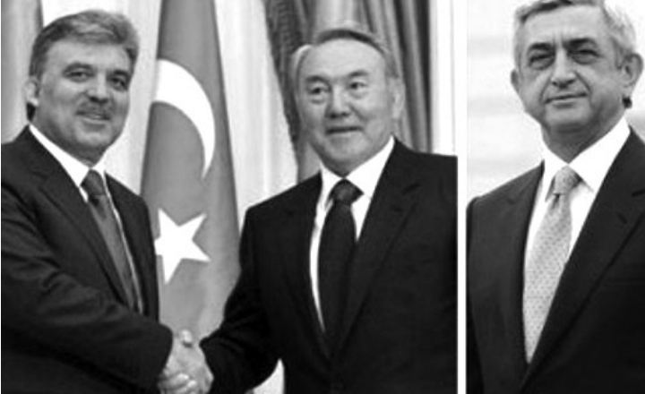
Արդեն հայտնվել են տեղեկություններ այն մասին, որ Եվրասիական տնտեսական միության հիմնադիր անդամները կարող են ունենալ վեժնի իրավունք պապա Միության՝ այլ երկրների ան-

Ղազախստանի նախագահ Նուրսուլթան Նազարբաևը Թուրքիայում հայտարարել է, որ Թուրքիան կարող է դառնալ Եվրասիական տնտեսական միության ասոցացված անդամ: Այդ մասին նա ասել է Թուրքիայի պետությունների համագործակցության խորհրդի չորրորդ գագաթաժողովի ժամանակ կայացած մամլո ասուլիսի ժամանակ: «Եվրասիական տնտեսական միության պայմանագիրը բաց է այլ պետությունների անդամակցման համար: Օրինակ՝ Թուրքիան եւ այլ երկրներ կարող են ապագայում դառնալ տվյալ միավորման ասոցացված անդամ», - նշել է Նազարբաևը: