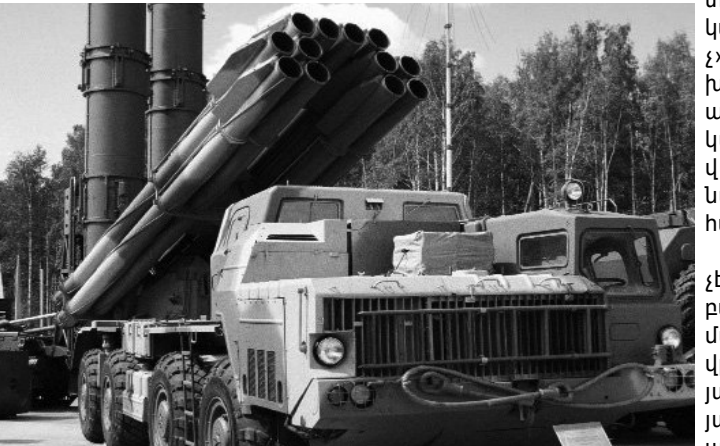
Նախօրեին Հայաստանի Հանրապետության պաշտպանության նախարար Սեյրան Օհանյանը հայտարարել էր, որ մենք պետք է հակառակորդի, այսպես ասաց, «ռազմատենչ եռանդը» լուծենք հակազործողությունների կամ կանխարգելիչ գործողությունների միջոցով՝ ավելացնելով, որ

Ադրբեջանի պաշտպանության նախարարության մամուլի ծառայության ղեկավար Վազիֆ Դարգյահլին սպառնացել է Հայաստանին մեծ քանակությամբ զինտեխնիկայով՝ հիմնականում ռուսական արտադրության, հայտարարելով. «Բավական է միայն նշել, որ Նախիջեւանում տեղակայված «Սմերչ» հրթիռային համազարկի համալիրը ունակ է ոչնչացնել Հայաստանում գտնվող ցանկացած թիրախ»: Նա այս մասին հայտարարությունն արել է՝ մեկնաբանելով Հայաստանի Հանրապետության պաշտպանության նախարար Սեյրան Օհանյանի՝ հունիսի 12-ին, խորհրդարանում արած հայտարարությունը: