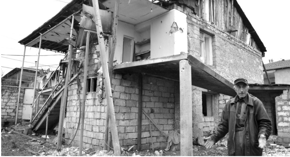
Ապրիլյան քառօրյա պատերազմի ընթացքում ադրբեջանական կողմը հրետակոծել է Մարտակերտի մի շարք բնակավայրեր: Հրետակոծության հետևանքով վնասվել է Մատաղիսի ՅԷԿ-ը, Թալիշի, Մատաղիսի եւ Մարտակերտի դպրոցներն ու մանկապարտեզները, տասնյակ տներ հակվել են շարքից: