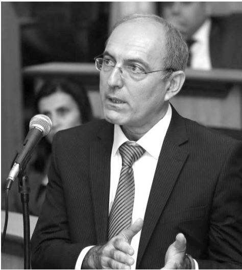
«Ապառաժ»-ի թղթակիցը քառօրյա պատերազմի, դրա հետևանքների մասին խոսել է ԼՂՀ ԱԺ փոխնախագահ, Արցախի ԿԿ անդամ Վահրամ Բալայանի հետ:

- Չինադադարից 22 տարի անց տեղի ունեցած 4-օրյա պատերազմը բոլորի համար անսպասելի էր: Եւ հիմա հաճախ է խոսվում թե՛ մեր բացթողումների, թե՛ առավելությունների մասին: Ի վերջո, ո՞րն էր այն ամենամեծ դասը, որ քաղցինը քառօրյա պատերազմից: