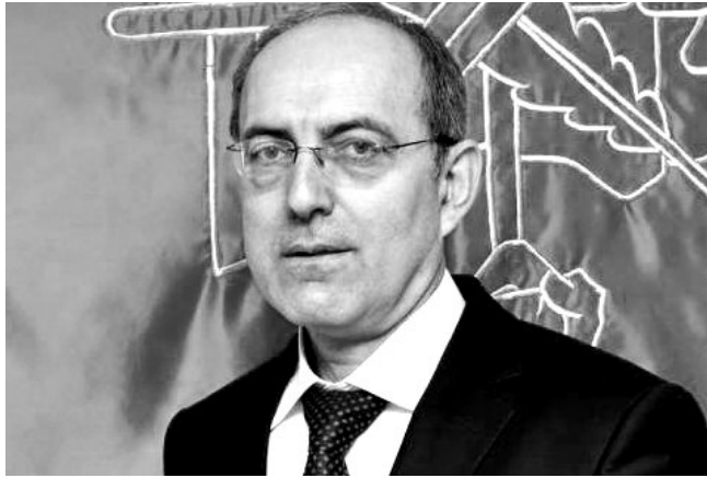
ՀՀԴ ԿԿ անդամ, Արցախի Հանրապետության Ազգային ժողովի փոխնախագահ, պատմական գիտությունների դոկտոր, պրոֆեսոր Վահրամ Բալայան

1980-ական թվականների վերընթացող փուլում Արցախյան ազգային-ազատագրական շարժումը շատ բան փոխեց հայության կյանքում: